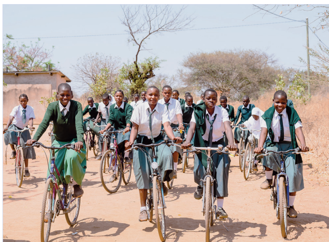
Velafrica sorgt dafür, dass Adliswiler Velos ein zweites Leben in Afrika erhalten.

Die Organisation Velafrica macht ausgediente Velos fit und exportiert sie nach Afrika, wo sie Schulwege verkürzen und Arbeitsplätze schaffen. Seit längerer Zeit können Adliswilerinnen und Adliswiler ausgemistete Velos beim Entsorgungshof Tüfi für Velafrica abgeben. Aktuell bietet Velafrica einen Abholservice am 12. und 13. April 2022 im Bezirk Horgen an. Bis am 7. April können Sie Ihre Velospende anmelden, dann werden die Velos direkt vor Ihrer Haustüre abgeholt: velafrica.ch/abholaktion-horgen