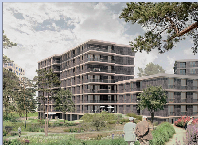
Visualisierung des Sihlsana Neubaus mit öffentlicher Parkanlage.

Das Planungsteam hat entscheidende Fortschritte gemacht: Es hat das siegreiche Wettbewerbsprojekt «Sophie» mehrfach optimiert und die Umsetzungsbedingungen geklärt. Dank geschärftem und optimiertem Vorprojekt kann voraussichtlich im Mai 2022 die Baueingabe erfolgen. Dass die Planungsphase dieses Neubaus derart viel Raum einnimmt, erklärt die Komplexität des Vorhabens: Mit dem Neubau führt die Sihlsana neue, innovative Wohn- und Pflegekonzepte ein. Diese ermöglichen es ihr, noch besser auf die individuellen Bedürfnisse ihrer Bewohnerinnen und Bewohner sowie deren spezifischen Lebenssituationen einzugehen. Die Sihlsana und das Planungsteam standen zudem vor der Herausforderung, alle Räumlichkeiten auf die geplanten, teilweise neuartigen Dienstleistungskonzepte von Wohnen, Pflege, Gastronomie und Logistik abzustimmen. Dabei hatten sie nicht nur die Betriebsfunktionen zu berücksichtigen, sondern auch die wirtschaftliche Tragbarkeit im Auge zu behalten. Nun ist es gelungen, das Projekt so auszugestalten, dass es den hohen Anforderungen und der gewünschten Qualität gerecht wird.