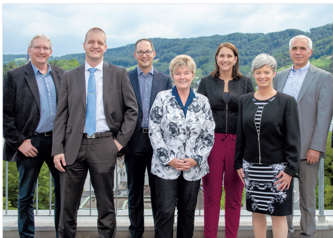
Der Stadtrat blickt auf die Legislatur 2018 – 2022 zurück.

Am 27. März 2022 fanden in Adliswil Erneuerungswahlen für den Stadtrat, die Schulpflege sowie den Grossen Gemeinderat statt. Damit endet auch die Legislatur des bisherigen Stadtrats. In seinem Abschlussbericht zur Legislatur blickt er zurück auf die Ziele, die er sich vor vier Jahre gesetzt hat sowie auf besondere Projekte, die in dieser Zeit umgesetzt wurden. Den Bericht finden Sie hier: adliswil.ch/legislaturbericht