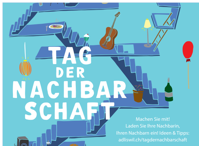
Der Tag der Nachbarschaft wird auch in Adliswil gefeiert.

Nicht verpassen: die Gemeinwesenarbeit setzt sich dafür ein, dass in Adliswil der Tag der Nachbarschaft am 20. Mai 2022 intensiv gefeiert wird. Die Stadt freut sich, wenn nachbarschaftliche Beziehungen im Haus, in der Siedlung oder im Quartier über alle Generationen hinweg aktiv gelebt werden. Am diesjährigen Tag der Nachbarschaft möchte die Stadtverwaltung alle ermuntern, aktiv auf Nachbarinnen und Nachbarn zuzugehen. Auch kleine Anlässe oder unkomplizierte nachbarschaftliche Gesten entfalten grosse Wirkung. Unter adliswil.ch/tagdernachbarschaft gibt es Tipps für Ihre persönlichen Nachbarschaftsaktionen und im Stadthaus kann auf Anmeldung ein Mitmach-Set abgeholt werden.