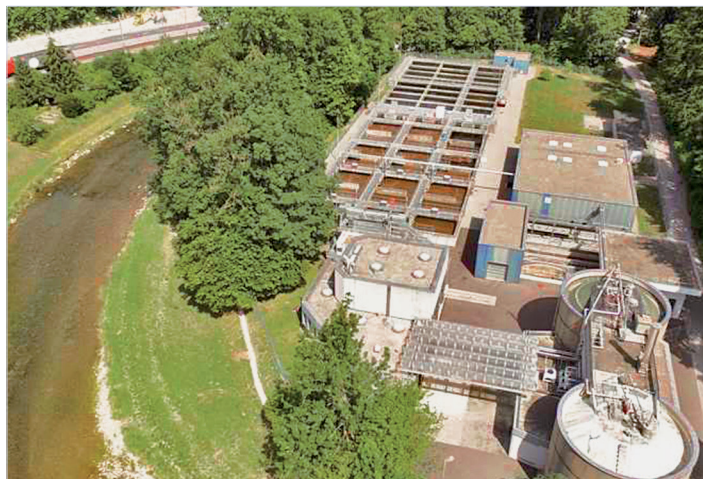
Je mehr Einwohner, umso mehr Abwasser: Die ARA Sihltal testet innovative Methoden.

Von Juni 2018 bis Februar 2019 testete die ARA Sihltal zusammen mit der Eawag (Wasserforschungsinstitut der ETH) eine neuartige Technologie. Diese ermöglicht einen platzsparenden Ausbau der Kläranlage und reduziert gleichzeitig den Energieverbrauch. Dabei wurde ein spezielles Sieb, ähnlich einer riesigen Waschtrommel, vor das Belebtschlammbecken (Verfahren zur biologischen Abwasserreinigung) geschaltet. Weil dieses alle Feststoffe zurückhält, die grösser sind als 0,2 Millimeter, landen im Belebtschlammbecken nur noch die gelösten Stoffe. «Dadurch braucht es weniger Bakterien, die das Abwasser klären», erklärt Ingenieur Nicolas Derlon von der Eawag. Weil auch weniger Sauerstoff in die Becken gepumpt werden muss, kann man bis zu einem Drittel Energie einsparen. Die Testphase in der ARA Sihltal zeigte ausserdem: Das Trommelsieb erhöht auch die Energieleistung der zugehörigen Biogasanlage. Grund dafür ist, dass die vom Sieb zurückgehaltene Feststoffmasse direkt in Methan umgewandelt werden kann. «Unsere Versuche zeigen, dass damit die Energieproduktion der Kläranlage mehr als verdoppelt werden könnte». Mittlerweile wurde das Sieb wieder entfernt und es wird geprüft, wie die gewonnen Erkenntnisse für die Zukunft genutzt werden können.