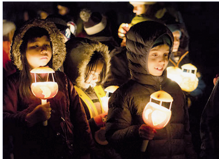
Bald leuchten wieder zahlreiche Kinderaugen im Schein der Räbeliechtli.

Feuerwehr, Werkdiensten und weiteren Abteilungen logistisch sowie finanziell. 13 Unternehmen aus dem Adliswiler Gewerbesponsoren den Anlass. 50 Freiwillige setzen sich vor und während des Umzugs für einen reibungslosen Ablauf ein. 800 Räben schmücken die Häuser und Gärten entlang der Route. Drei lokale Musikgruppen geben dem Umzug akustisches Geleit. Elf Mitglieder des Vereins Räbeliechtliumzug Adliswil koordinieren, planen und halten die Fäden zusammen und schliesslich ziehen an die 700 Kinder durchs Sood-Quartier. Am Freitag, 15. November 2019 ist um 18.15 Uhr Besammlung auf dem Pausenplatz der Schule Werd. Der Start erfolgt um 18.30 Uhr. Weitere Infos: raebeliechtliumzug-adliswil.jimdo.com