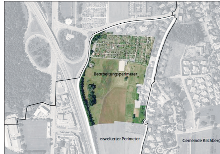
Das Gebiet Lätten liegt zwischen Adliswil, Zürich und Kilchberg an der Autobahn A3.

von vier Workshops mit einer Begleitkommission aus Mitgliedern der Stadt Adliswil, der Stadt Zürich, der Gemeinde Kilchberg, der Eigentümerschaft, einer Anrainervertretung sowie Fachleuten weiterer Disziplinen werden die Zwischenstände des Masterplans jeweils diskutiert. Als Schlussprodukt wird ein konkretes städtebauliches Zielbild unter Berücksichtigung der Aspekte Nutzung, Freiraum, Verkehr und Lärm resultieren. Das Ergebnis dient als Grundlage für den weiteren Planungsprozess.