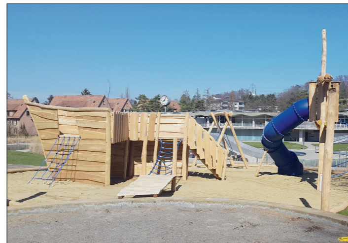
Das neue Piratenschiff im Freibad wird viele Kinder begeistern.

Das beliebte Freibad im Tal verfügt neben den Wasserflächen auch über eine Spielwiese, ein Beachvolleyballfeld, einen Sandkasten und einen Kinderspielplatz. Viele Gäste des Freibads sind Familien. Der bisherige Spielplatz und die Spielgeräte waren jedoch nicht für jedes Kinderalter geeignet, insbesondere nicht für Kleinkinder. In der Freibadsaison 2019 können sich die jungen Gäste nun auf einen neuen Spielplatz in Form eines Piratenschiffs freuen. Der Spielplatz verfügt über Kletterbereiche für unterschiedliche Ansprüche, zwei Rutschbahnen sowie eine grosse Schaukel. Übrigens: die Freibadsaison 2019 startet am 11. Mai 2019!