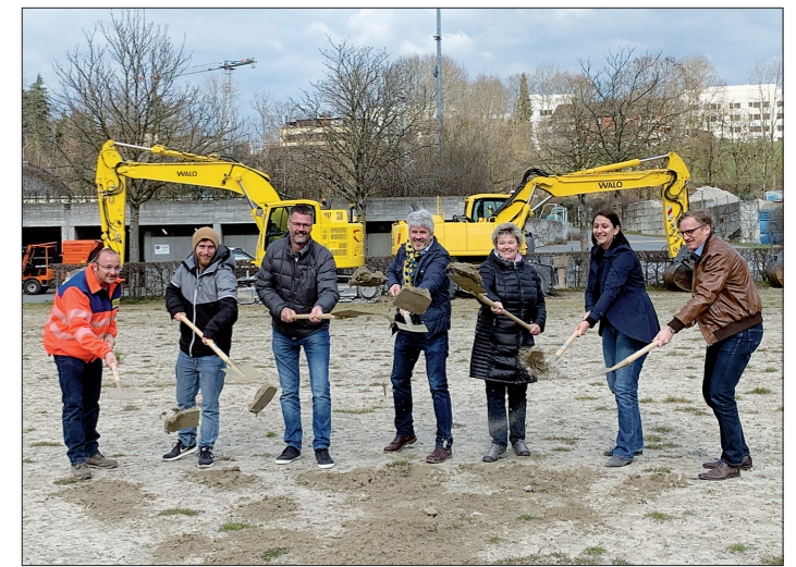
Es geht los mit dem Umbau des Sportplatzes Tüfi.

umgebaut, der ganzjährig und unabhängig vom Wetter bespielbar ist. Aufgrund der Nähe zur Sihl wird ein sogenannter „unverfüllter“ Kunstrasen ohne Kunststoffgranulat eingebaut. Ausserdem wird der heutige Sandplatz mit einer Multifunktionsfläche aus Asphaltbelag ersetzt und es werden zusätzliche Parkplätze realisiert. Der Kunstrasen wird voraussichtlich ab Ende Sommer 2019 bespielbar sein.