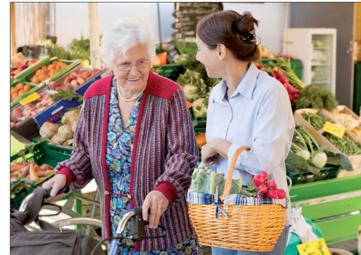
Nachbarschaftshilfe kann auch eine Unterstützung beim Einkaufen sein.