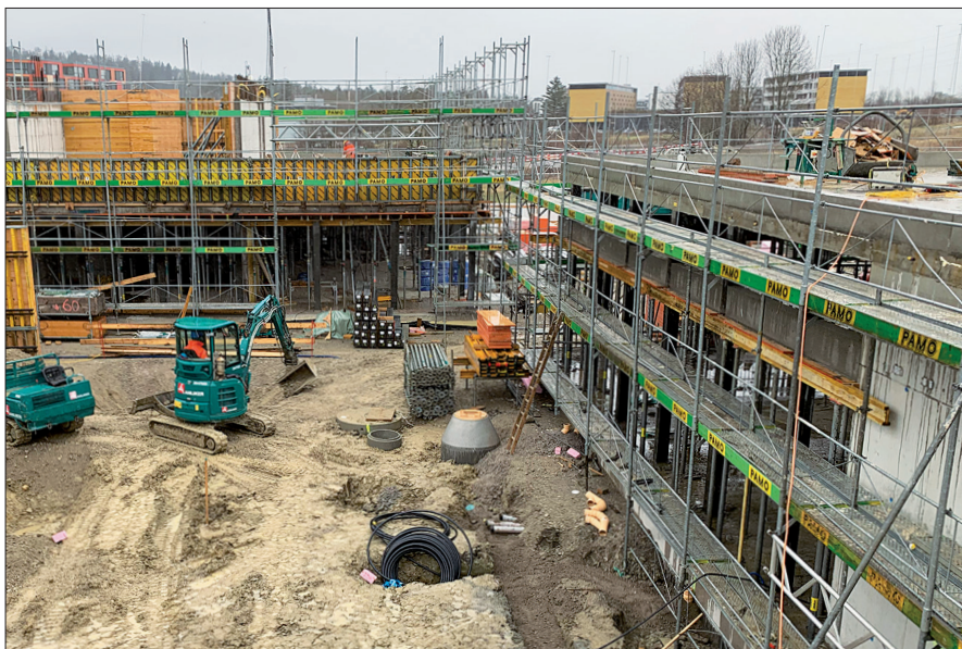
Der Rohbau für das neue Schulhaus wird noch in diesem Frühling fertiggestellt.