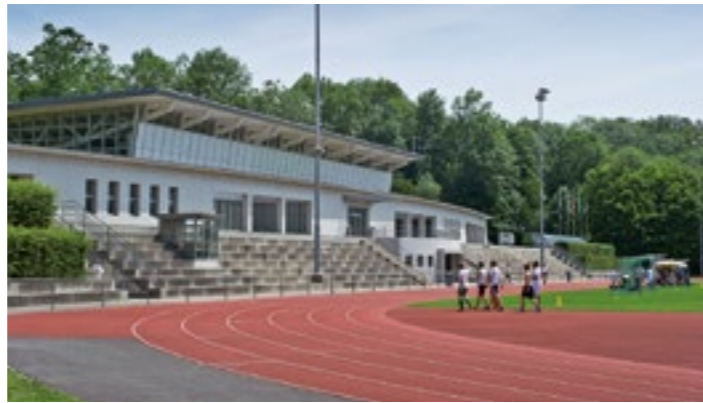
Wie zufrieden sind Sie mit der Adliswiler Sportinfrastruktur?

Die Stadt Adliswil besitzt zahlreiche Sportanlagen, die sich grosser Beliebtheit in der Bevölkerung erfreuen. Das Hallen- und Freibad sowie die Anlage Tüfi sind die grösseren – es gibt aber noch eine Vielzahl weiterer Anlagen. Dazu zählen beispielsweise die Turnhallen, Rasen-, Hart- und Tennisplätze, Outdoor-Fitnessanlagen oder Skate- und Bikeparcours. Alle diese Anlagen sollen den Bedürfnissen sowie den technischen und wirtschaftlichen Anforderungen entsprechen. Für die Optimierung der städtischen Sportinfrastruktur erstellt die Stadt Adliswil zurzeit ein Konzept für die Gemeindesportanlagen (GESAK). Auf dessen Basis werden künftig Massnahmen und Projekte abgeleitet. Eine wichtige Basis für das GESAK sind die Bedürfnisse der Nutzenden. Die Bevölkerung, die Vereine und die örtlichen Unternehmen werden deshalb gebeten, an einer Umfrage teilzunehmen. Dort können sie festhalten, welche Anlagen sie wie häufig nutzen und wo sie Optimierungen sehen. Wir freuen uns sehr, wenn auch Sie an der Umfrage mitmachen und dazu beitragen, die Adliswiler Sportanlagen zu verbessern. Den Fragebogen finden Sie hier: www.adliswil.ch/gesak