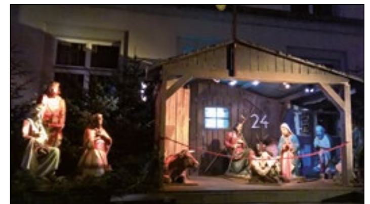
Der Bahnhofplatz wird in der Adventszeit zum feierlichen Stadtzentrum

Heuer zum 5. Mal wird die Aktion «Adliswiler Adventsfenster» durchgeführt. Der von den vier Adliswiler Kirchen (reformierte, katholische und methodistische Kirche sowie Chrischona Freikirche) initiierte spezielle «Adventskalender» soll die Stadt erhellen und erfreuen. Damit auch dieses Jahr jeden Tag ein spezielles Adventsfenster erleuchtet, werden kreative Personen gesucht, die ein gut einsehbares Fenster gestalten. Ziel ist es, jeden Tag eine neue Überraschung irgendwo in Adliswil bestaunen zu können. Die Sekretariate der vier Kirchen nehmen Anmeldungen gerne entgegen.