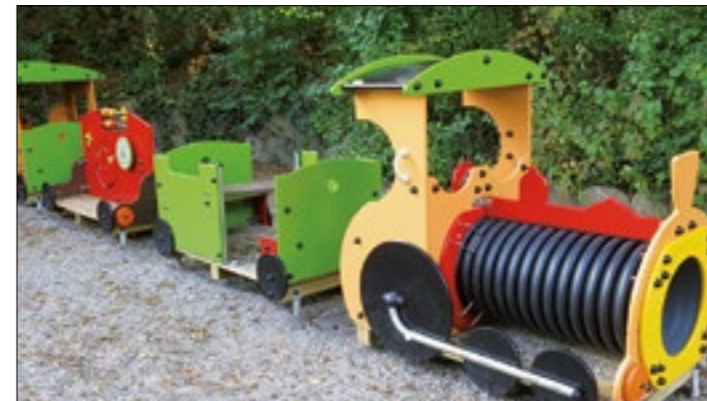
Neue farbigere Spielgeräte begeistern junge Besucherinnen und Besucher

Die Standorte der Spiel- und Grillplätze in Adliswil finden Sie hier: www.adliswil.ch/grill-spielplatz